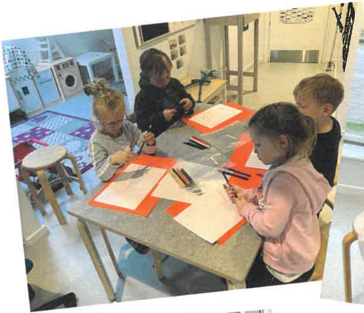
Børnene tegner deres hus