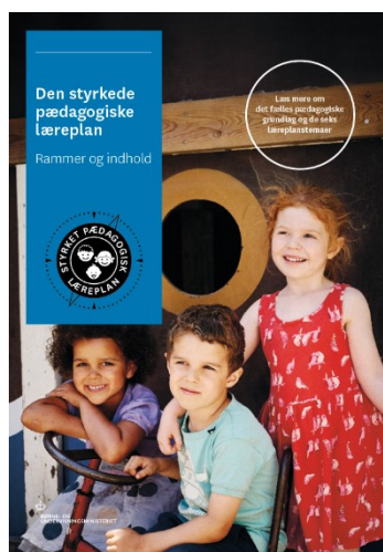
Den styrkede pædagogiske læreplan, Rammer og indhold

Denne skabelon indeholder alle de lovmæssige krav til evalueringen. Lovkravene finder I i de to midterste afsnit "Evaluering og dokumentation" og "Inddragelse af forældrebestyrelsen". Skabelonen indeholder desuden spørgsmål, som kan støtte jeres evalueringsproces samt jeres fremadrettede arbejde med løbende at revidere den skriftlige læreplan.