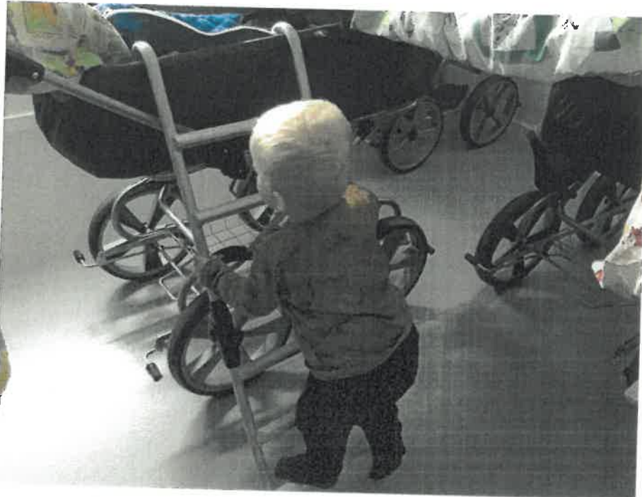
Jeg øver mig i, at kravle op af stigen til min barnevogn