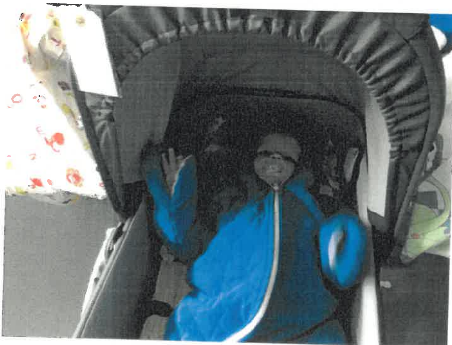
Godnat og sov godt