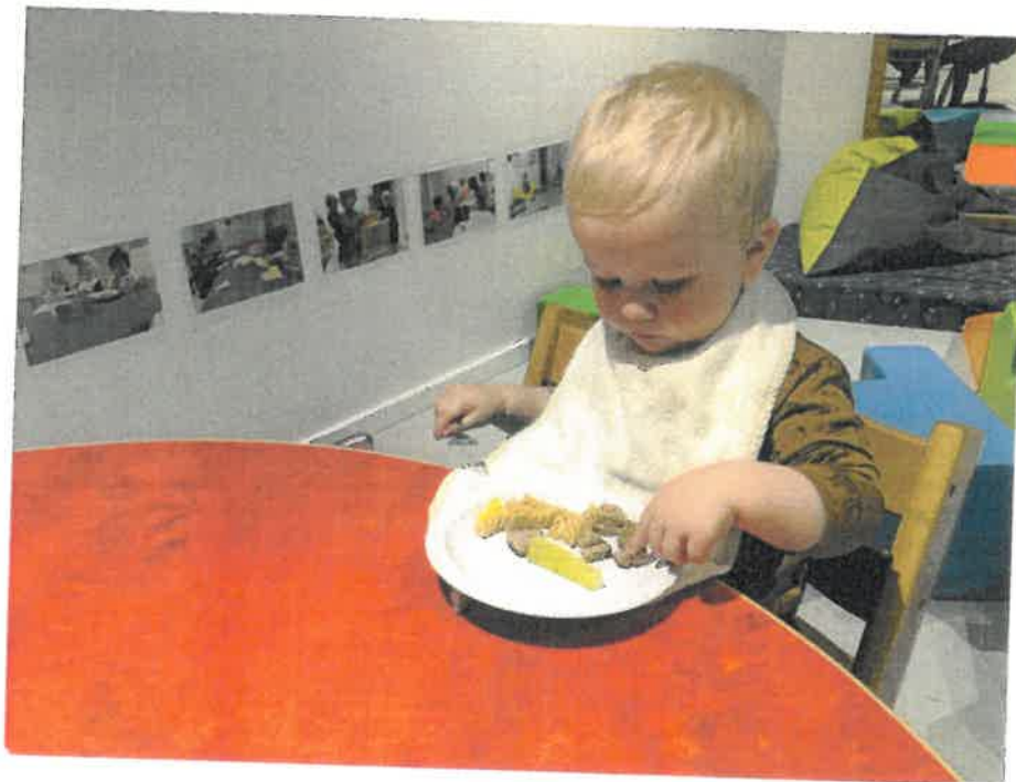
Jeg vil gerne lige mærke på maden inden jeg spiser den