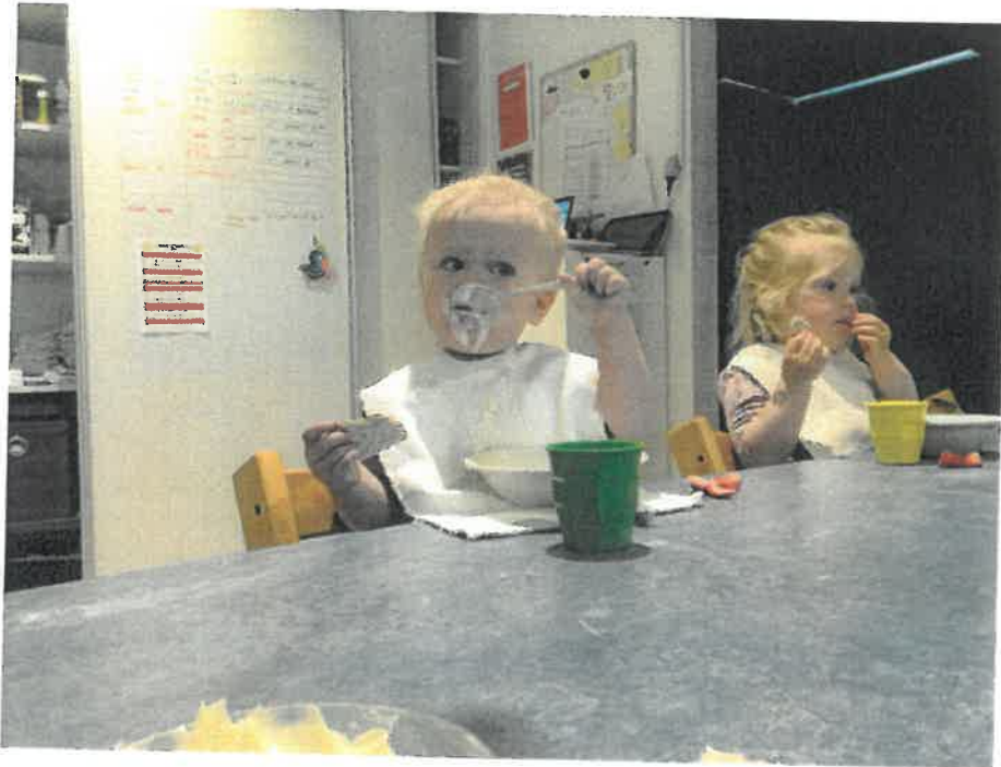
Jeg kan også selv spise med ske