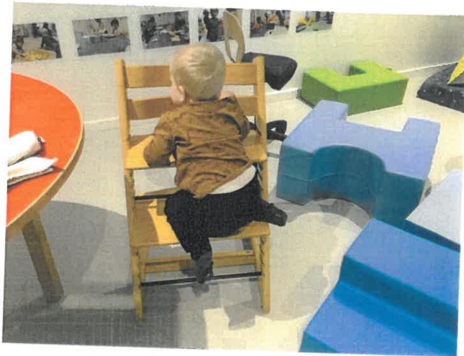
Jeg kravler selv op på stolen