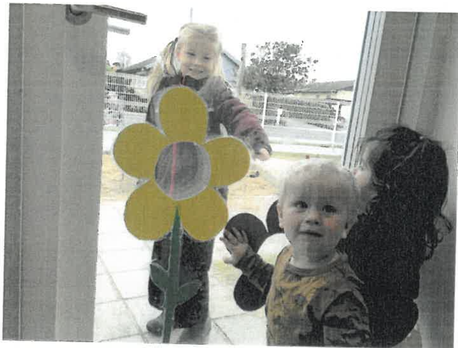
Så kom storesøster. Tak for idag