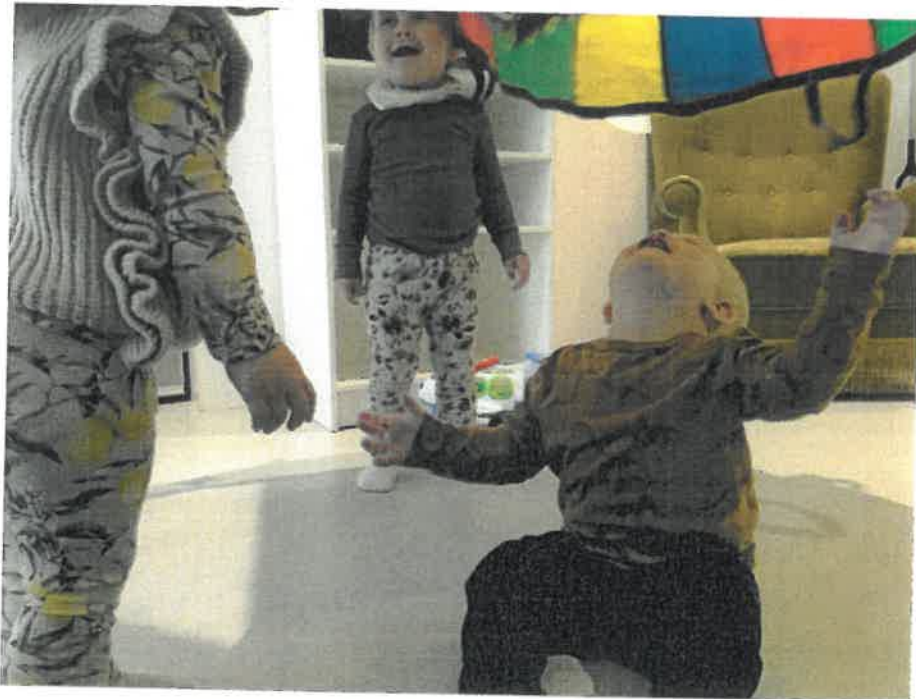
Det er også spændende at lege med faldskærmen